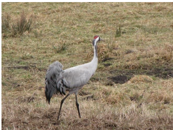
Området huser landets tætteste bestand af trane.